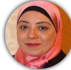
أ.د. علا الزيات مصر