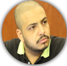
أ. إسلام العزيز مصر